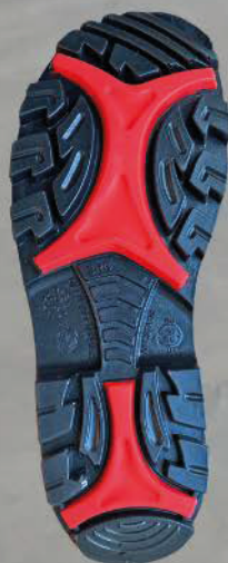
SUELA DE MATERIAL TPU